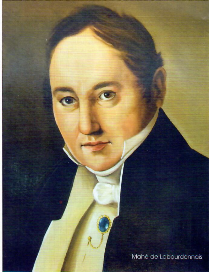
Mahé de Labourdonnais